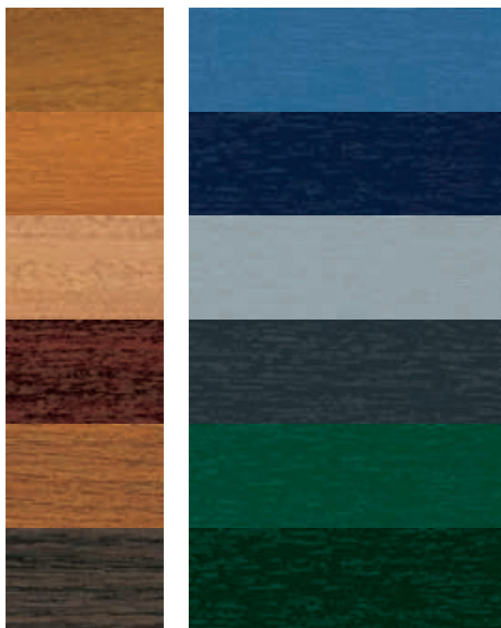
Om druktechnische redenen kunnen kleurverschillen mogelijk zijn

Ook de prestaties op het gebied van inbraakwering, statische eisen en wind- en waterdichtheid liggen met Schüco-systemen op het allerhoogste niveau.